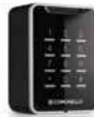
TACT / TACT RADIO